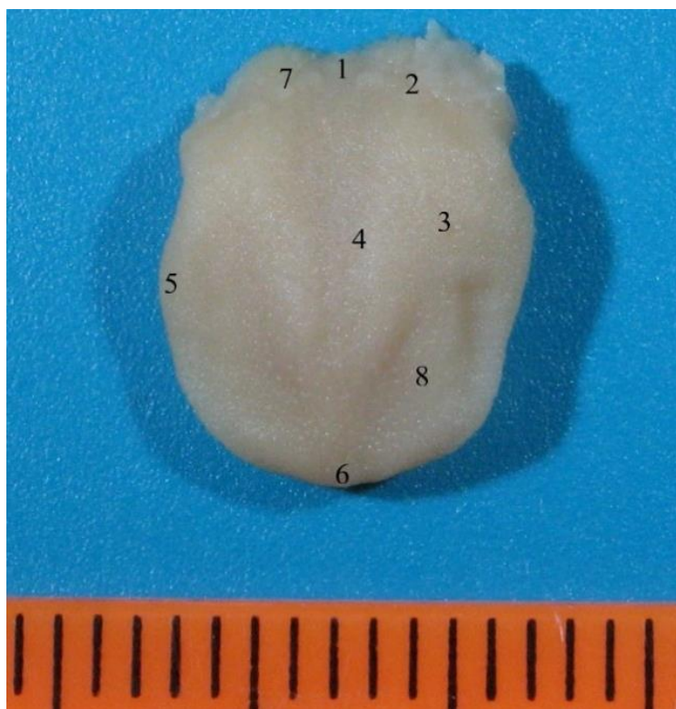
Рис. 2. Макропрепарат языка плода человека. Возраст – 17 недель, пол женский: 1 – слепое отверстие языка; 2 – пограничная борозда языка; 3 – спинка, предбороздовая часть тела языка; 4 – срединная борозда языка; 5 – край языка; 6 – верхушка языка; 7 – желобоватые сосочки языка; 8 – конусовидные, нитевидные, грибовидные сосочки языка

Развитие органов челюстно-лицевой области и черепа плода имеют тесные корреляционные связи, в том числе количественные (табл. 3).