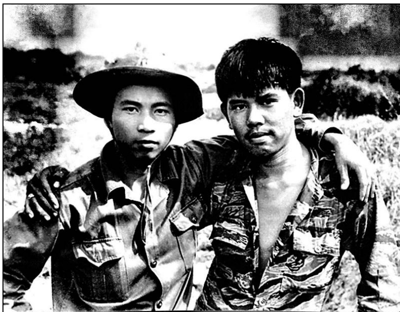
Два бойца [Hội nghị Paris 2018: 196]

Фотография сделана в 1973 г. в провинции Куангчи вблизи реки Бенхай, по которой после подписания Женевского соглашения (1954 г.) была проведена демаркационная линия. На снимке изображены два солдата разных армий — северовьетнамской и южновьетнамской, в момент обмена военнопленными. Эмоции двух бойцов отражают истинное отношение к войне разделённого на тот момент вьетнамского народа. Любопытно отметить, что несмотря на то, что снимок был сделан в 1973 г., его первая публикация состоялась лишь в 2007 г. [История одного снимка 2018].