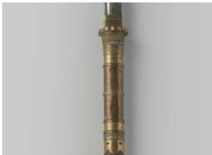
Рис. 26. Уплотнительная муфта и втулка боевой косы NG-NM-6089-А.

У каждого экспоната уплотнительная муфта упирается в округлую гарду в стиле японской цуба 鍔 (кит. э, вьет. нгак ) в виде цветка хризантемы. Древяно у всех трёх образцов изготовлено из кипариса и покрыто коричневым лаком. У образцов под номерами NG-NM-6089-А и NG-NM-6089-В древяно в сечении круглое, в то время как у японских нагината оно овальное [Барчевский, Ветюков 2018: 6]. Все описанные экземпляры снабжены кипарисовыми же ножами для клинков.