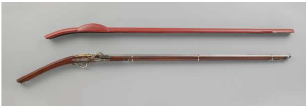
Рис. 4. Аркебуза NG-NM-6091 с чехлом-накладкой.

Похожее фитильное ружьё, но датированное второй половиной XVIII в., демонстрирует на своём сайте и П. Деккер. В пояснительной статье он прямо указывает на сходство с аркебузами из собрания К. Тромпа [Mandarin Mansion. A Vietnamese...: 11.10.2021].