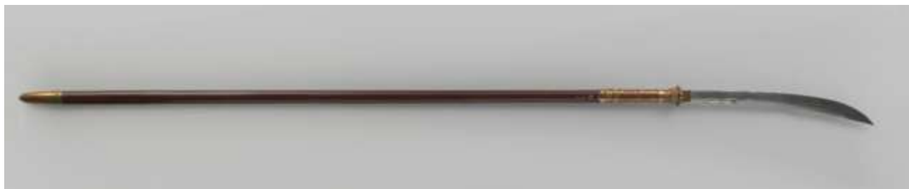
Рис. 2а. Боевая коса NG-NM-6089-A.

узорчатой гравировкой. Наверху она переходит в крепёжную муфту – в японской терминологии футти 縁 (кит. юань, вьет. зуен). У всех трёх экземпляров она имеет форму удлинённой полусферы с обращённым в сторону клинка основанием. У экспоната NG-NM-6089-A муфта имеет вид распутившегося цветка с узорчатыми лепестками, напоминая традиционный для буддийской иконографии лотосовый трон. У двух других муфта украшена идентичным сложным орнаментом, в котором угадываются те же зигзагообразные декоративные элементы, что образуют гривы львиных головок, украшающих стойку № NG-NM-6087-A. Можно допустить, что все три образца принадлежали одному набору и «лотосообразный» футти первоначально предназначался для более короткой боевой косы NG-NM-6090-A, в то время как два более крупных парных образца имели также и идентичные муфты. Остаётся только предполагать, на каком этапе эти элементы по ошибке поменяли местами – на стадии производства или в ходе не столь давнего демонтажа, предпринятого сотрудниками музея в исследовательских целях. Декор всех трёх уплотнительных муфт на сайте Рийксмузеума определён как характерный для Индокитая (рис. 2а, б).