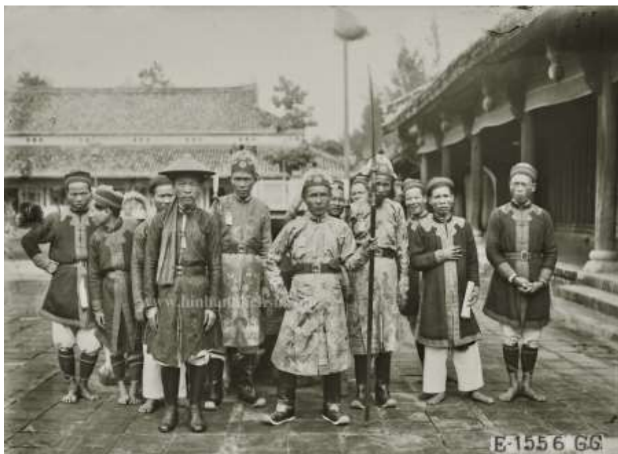
Рис. 6. Фотоснимок «Группа дворцовых гвардейцев и носильщиков королевского паланкина», 1926.