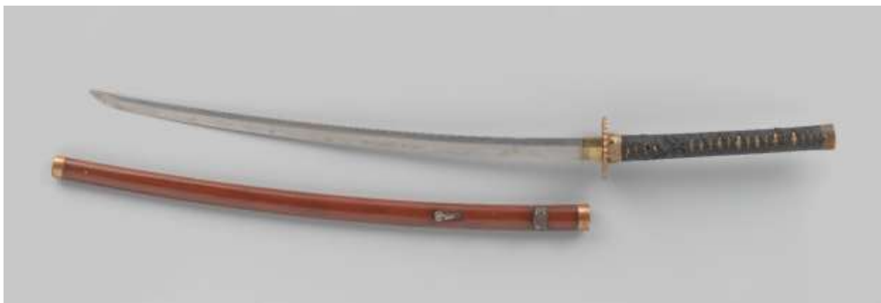
Рис. 3. Сабля NG-NM-6097-B.

Вьетнамский клинок XVI в. с бронзовой гардой и навершием похожей формы представлен в личной коллекции известного голландского антиквара и исследователя восточного оружия Питера Деккера. Фотография сабли размещена на его профессиональном сайте [Mandarin Mansion: 16th Century...: 11.10.2021]. В пояснительной статье приводятся примеры других аналогичных образцов. Упомянут клинок из собрания Петра Великого, хранящийся в коллекции Оружейной Палаты Московского Кремля (инв. № Ор-4503/1-2) [Музеи Московского кремля]. Интересно, что приобретён он был, судя по всему, именно в Голландии в ту же эпоху, когда формировалась коллекция адмирала Тромпа. Гарда петровского клинка по форме практически идентична образцам из Рийксмузеума.