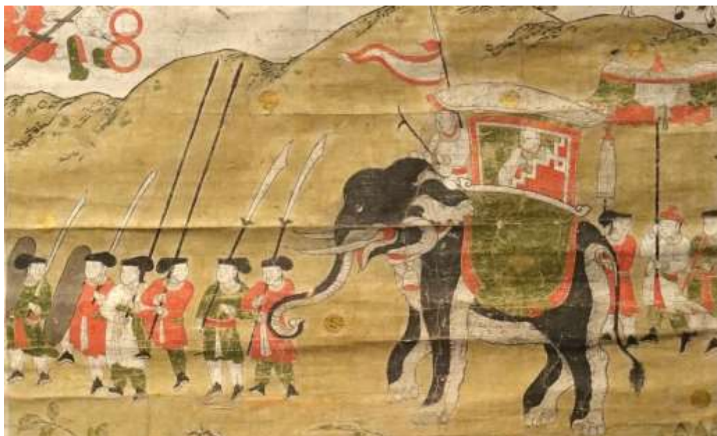
Рис. 5. «Чествование военного чиновника», 1784 (фрагмент).

Во главе процессии шествуют воины со слабоизогнутыми «двуручными» саблями, несколько стилизованными (обе имеют расширение верхней трети клинка, а одна – нефункциональную для оружия с таким балансом, скошенную к острию елмань, характерную для более коротких клинков китайского типа). Прибор (как и у чюонг дао ) передан условно – в несколько штрихов, за которыми, впрочем, при известной живости воображения, можно разглядеть полусферическое основание (муфту) и лежащую на ней гарду. Вполне вероятно, что на свитке представлены стилизованные изображения островных катана либо их местных подражаний.