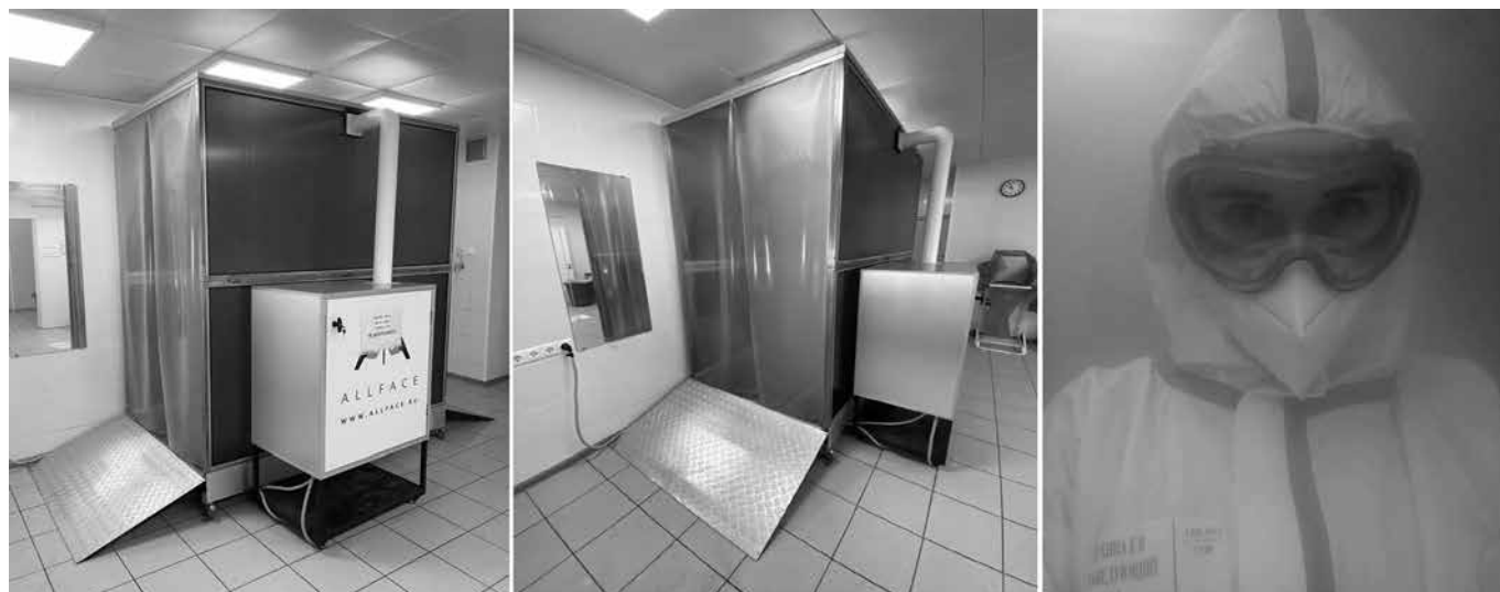
Рис. 2. Дезинфекционный туннель при выходе из «грязной» зоны. Fig. 2. Disinfection tunnel when leaving the «dirty» area.

следующим оседанием на СИЗ. Время нахождения в туннеле — 10–60 с.